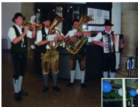
Musikalischer Empfang der Ehrengäste im Deutschen Museum