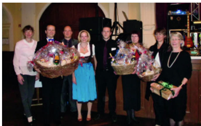
Die Gewinner des Ratespiels der Aktivitas