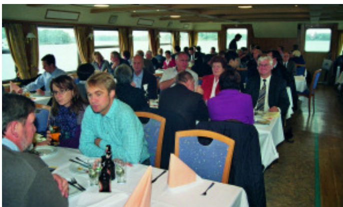
Schiffahrt auf dem Chiemsee