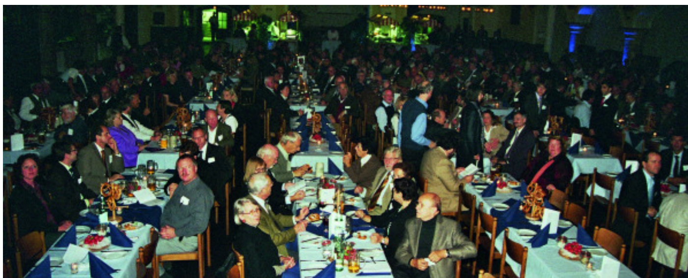
Blick in den Festsaal des Löwenbräukellers am Begrüßungsabend