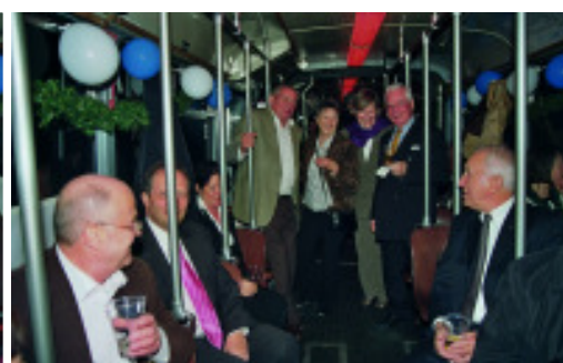
... mit bester Stimmung und Musik