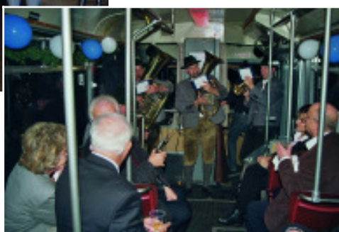
Nächtliche Stadtrundfahrt der besonderen Art...