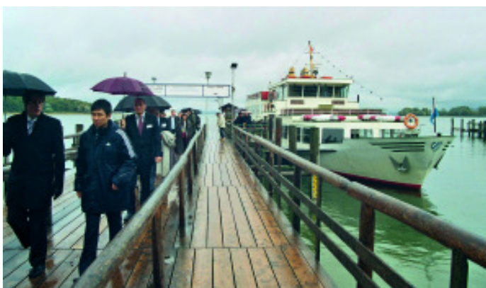
Herrenchiemsee – Wasser von unten und von oben