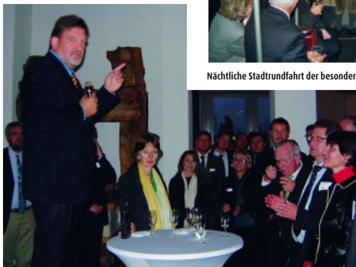
Aperitif, Ansprache und Rundgang in der Papierabteilung