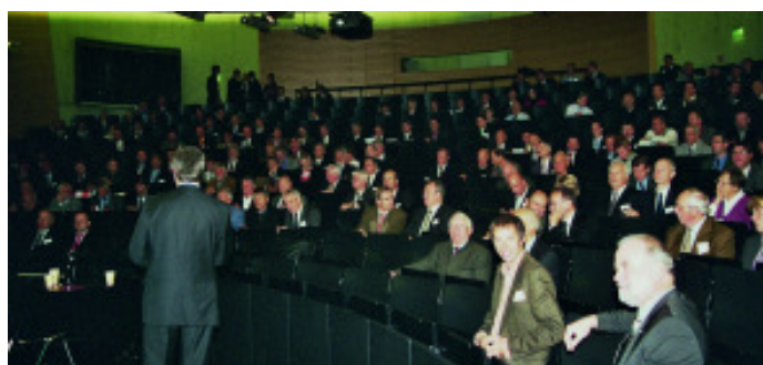
Blick in den Saal bei den Fachvorträgen