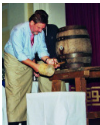
... übernimmt gekonnt das O'zapfn...